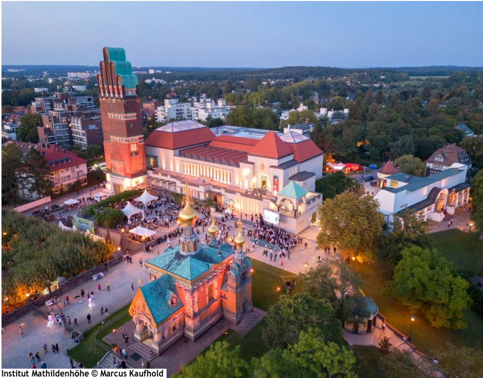
Institut Mathildenhöhe

Programm der gemeinsamen Jahrestagung des UNESCO-Welterbestätten Deutschland e.V. und der Deutschen UNESCO-Kommission