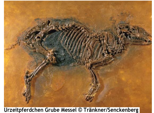
Urzeitpferdchen Grube Messel